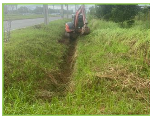
รูปที่ 2 การขุดลอกท่อระบายน้ำเสียและรางระบายน้ำฝนและบ่อฝัง