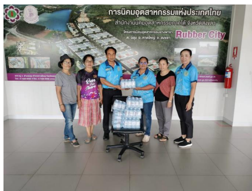
สนต. ร่วมสนับสนุนน้ำดื่มเพื่อใช้ในการต้อนรับผู้เข้าร่วมงานทอดกฐินสามัคคีประจำปี 2566