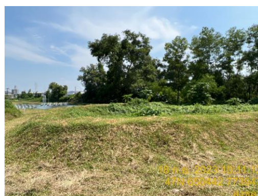
รูปที่ 6 บ่อพักน้ำทิ้งฉุกเฉิน (Emergency Pond)