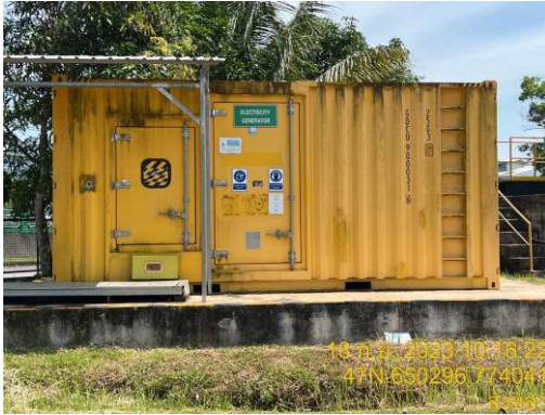
ตู้สำรองไฟ