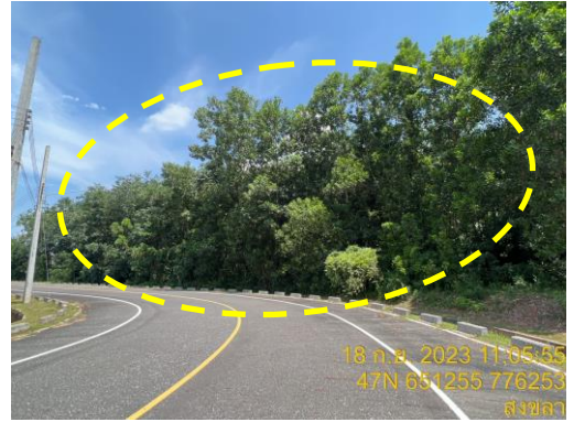
รูปที่ 25 สภาพแวดล้อมโดยรอบพื้นที่นิคมฯ (เป็นพื้นที่สีเขียวและสวนยางพารา)