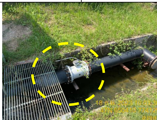
รูปที่ 5 เครื่องวัดอัตราการไหลของน้ำทิ้งและเครื่องวัดค่า COD ที่จุดปล่อยน้ำทิ้งจากบ่อพัก