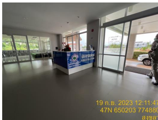
รูปที่ 17 สำนักงานนิคมอุตสาหกรรมภาคใต้ จังหวัดสงขลา