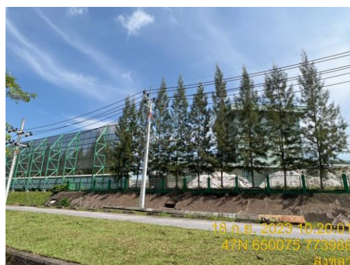
รูปที่ 24 พื้นที่สีเขียวรอบรั้วโรงงานของโรงงานต่างๆ