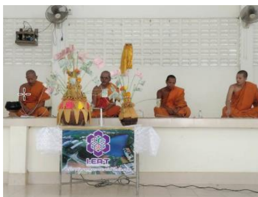
ร่วมกับชุมชนหมู่ที่ 3 ต.ฉลุง อ.หาดใหญ่ จ.สงขลา ร่วมรณรงค์สืบสานงานประเพณีวันสารทเดือนสิบ