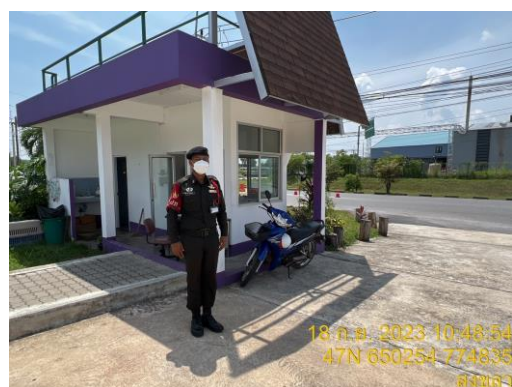
รูปที่ 11 เจ้าหน้าที่รักษาความปลอดภัย