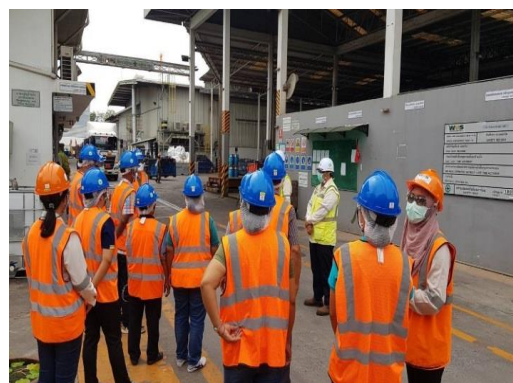
รูปที่ 21 พนักงานสวมใส่ PPE