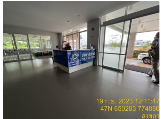
รูปที่ 17 สำนักงานนิคมอุตสาหกรรมภาคใต้ จังหวัดสงขลา