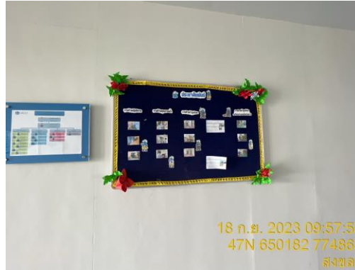
บริเวณสำนักงานนิคมฯ