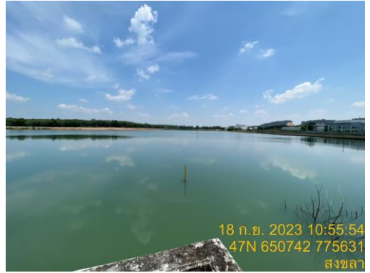
อ่างเก็บน้ำดิบแห่งที่ 2 (ความจุ 1,600,000 ลบ.ม.)