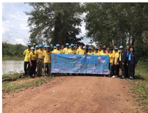
สนต. ร่วมโครงการหนึ่งตำบลหนึ่งแหล่งน้ำ