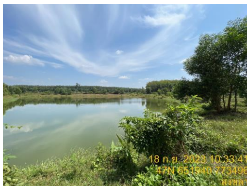
รูปที่ 22 พื้นที่จัดสร้างบ่อหน่วงน้ำในพื้นที่ระยะที่ 3