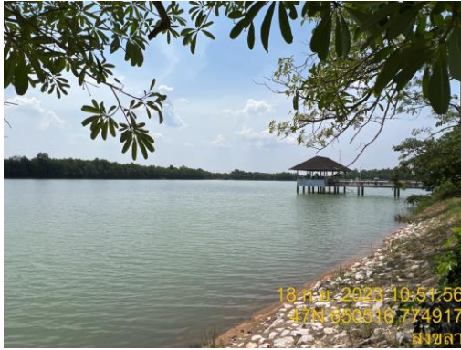
อ่างเก็บน้ำดิบแห่งที่ 1 (ความจุ 1,400,000 ลบ.ม.)