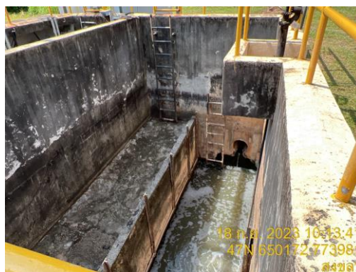
รูปที่ 3 ระบบบำบัดน้ำเสียส่วนกลางของนิคมฯ