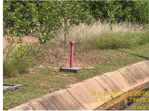
รูปที่ 19 อุปกรณ์ดับเพลิงในพื้นที่โครงการ ทุกๆ 200 เมตร