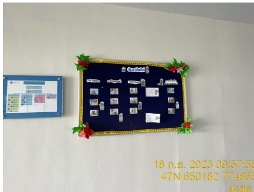
บริเวณสำนักงานนิคมฯ