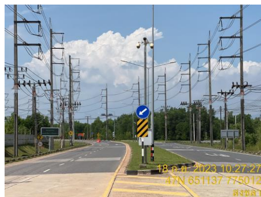
รูปที่ 12 ระบบการจราจร เส้นทางต่างๆ ในพื้นที่โครงการ