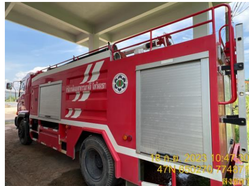
รูปที่ 20 รถดับเพลิงประจำโครงการ