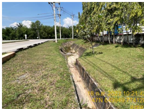
รูปที่ 1 ระบบระบายน้ำฝนของโรงงานและนิคมฯ