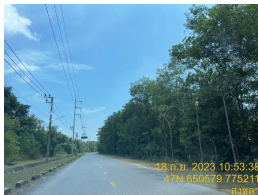
รูปที่ 23 พื้นที่สีเขียวภายในนิคมฯ