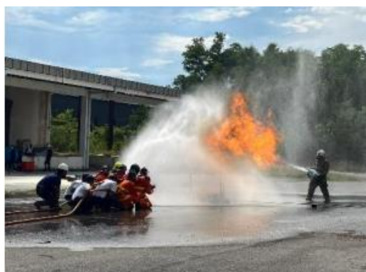
รูปที่ 18 การอบรม/การซ้อมแผนฉุกเฉิน