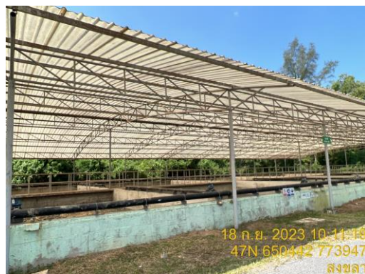
รูปที่ 10 กากตะกอนจากระบบสาธารณสุขโรค